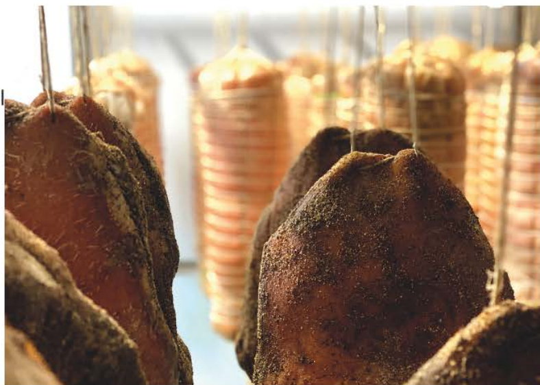
In alto: i guanciali stagionati Macelleria Zivieri e le coppe estive . A sinistra: l' azienda agricola Zivieri è situata nella cornice verde dei colli a Sasso Marconi (BO) .