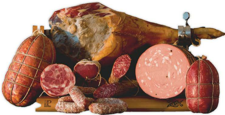
La gamma di salumi artigianali della Macelleria Zivieri.